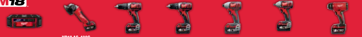
M18 PRCDAB+ 4933472112 | HD18 AG-402C Ø 115: 4933441300 Ø 125: 4933441507 | M18 BPD-402X 4933446192 | M18 BDD-402X 4933446198 | M18 BID-402C 4933443580 | M18 BIW-402C 1/2": 4933443607 | M18 BHG-502C 4933459772