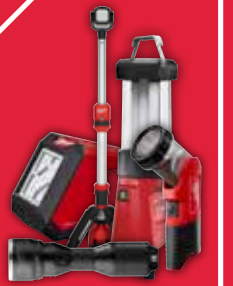
DAS GANZE BELEUCHTUNGSSORTIMENT FINDEN SIE IN UNSERER PROGRAMMÜBERSICHT.