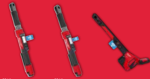
M12 ONEFTR38-201C 4933464967 M12 ONEFTR12-201C 4933464970 M12 PL-201C 4933478615