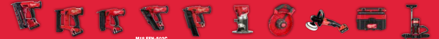
NEU M18 FN16GA-202X 4933478092 | M18 FNC518GS-202X 4933471940 | M18 FN18GS-202X 4933471407 | M18 FFN-502C 4933471404 | M18 FFNS-502C 4933478302 | M18 FFN21-0C 4933478993 | M18 FTR8-0X 4933479073 | M18 FPFT-0 4933471952 | M18 FAP180-502X 4933451550 | M18 FPOVCL-0 4933478187 | M18 FBPV-0 4933464483