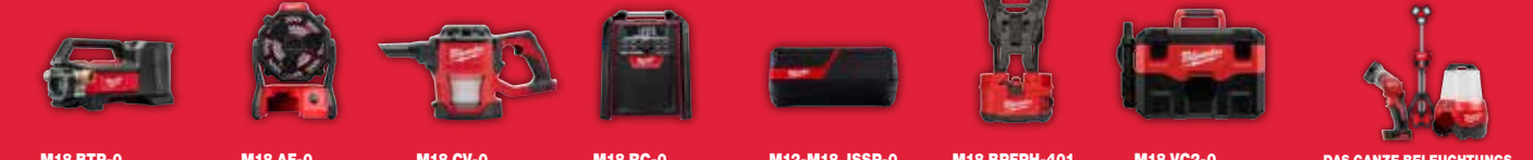
M18 BTP-0 4933471494 | M18 AF-0 4933451022 | M18 CV-0 4933459204 | M18 RC-0 4933446639 | M12-M18 JSSP-0 4933459275 | M18 BPPFH-401 4933464962 | M18 VC2-0 4933464029 | DAS GANZE BELEUCHTUNGS-SORTIMENT FINDEN SIE IN UNSERER PROGRAMMÜBERSICHT.