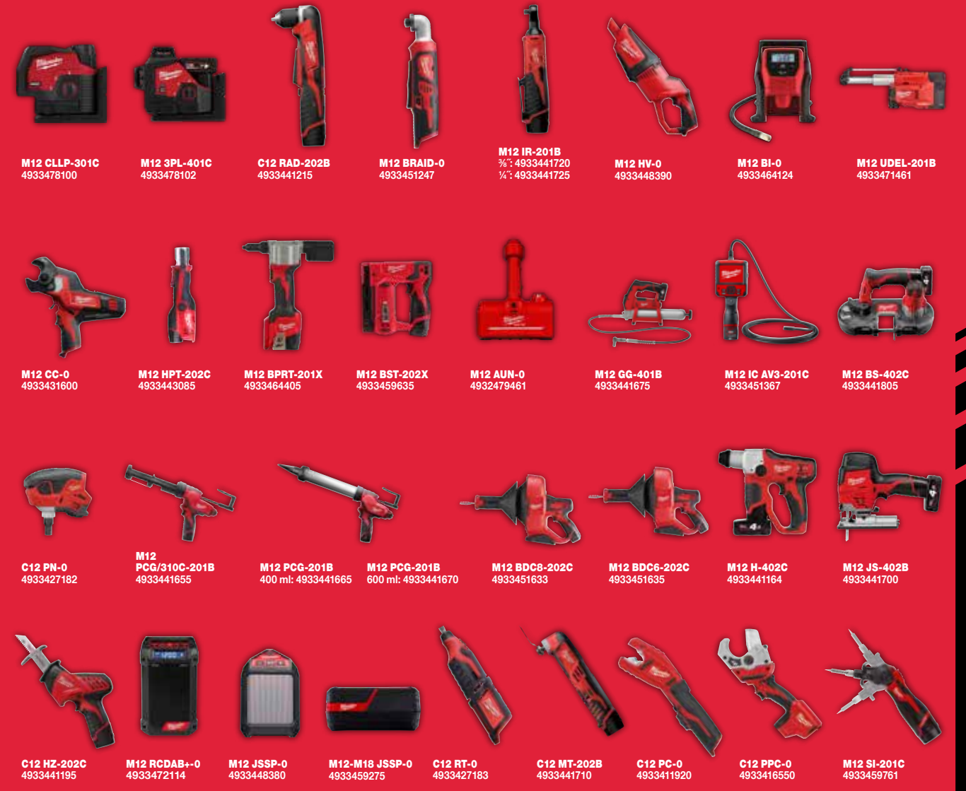
M12 CLLP-301C 4933478100 M12 3PL-401C 4933478102 C12 RAD-202B 4933441215 M12 BRAID-0 4933451247 M12 IR-201B 3/8: 4933441720 1/2: 4933441725 M12 HV-0 4933448390 M12 BI-0 4933464124 M12 UDEL-201B 4933471461 M12 CC-0 4933431600 M12 HPT-202C 4933443085 M12 BPRT-201X 4933464405 M12 BST-202X 4933459635 M12 AUN-0 4932479461 M12 GG-401B 4933441675 M12 IC AV3-201C 4933451367 M12 BS-402C 4933441805 C12 PN-0 4933427182 M12 PCG/310C-201B 4933441655 M12 PCG-201B 400 ml: 4933441665 M12 PCG-201B 600 ml: 4933441670 M12 BDC6-202C 4933451633 M12 BDC6-202C 4933451635 M12 H-402C 4933441164 M12 JS-402B 4933441700 C12 HZ-202C 4933441195 M12 RCDAB+-0 4933472114 M12 JSSP-0 4933448380 M12-M18 JSSP-0 4933459275 C12 RT-0 4933427183 C12 MT-202B 4933441710 C12 PC-0 4933411920 C12 PPC-0 4933416550 M12 SI-201C 4933459761