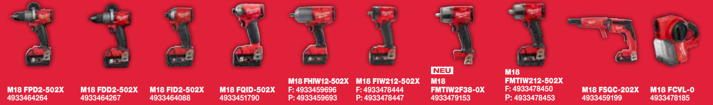
M18 FPD2-502X 4933464264 | M18 FDD2-502X 4933464267 | M18 FID2-502X 4933464088 | M18 FQID-502X 4933451790 | M18 FHIW12-502X F: 4933459696 P: 4933459693 | M18 FIW212-502X F: 4933478444 P: 4933478447 | NEU M18 FMTIW2F38-0X 4933479153 | M18 FMTIW212-502X F: 4933478450 P: 4933478453 | M18 FSGC-202X 4933459199 | M18 FCVL-0 4933478185