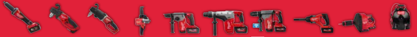
M18 FDG-502X 4933459107 | M18 CRAD2-0X 4933471641 | M18 FRAD2-0 4933471207 | M18 FPM-0X 4933459719 | NEU M18 FHX-552X 4933478889 | M18 CHM-121C 4933471284 | NEU M18 ONEFHPX-552X 4933478496 | NEU M18 FCVNI2-551 Ø 10: 4933459685* Ø 8: 4933459683* | M18 FDCPF-201C Ø 16: 4933459710 | M18 FFSDC-502 4933478185