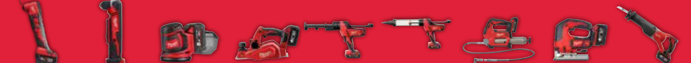
M18 BMT-421C 4933446210 | C18 RAD-0 4933427189 | M18 BOS125-502B 4933464229 | M18 BP-402C 4933451114 | C18 PCG/310C-201B 4933441310 | C18 PCG-201B 400 ml: 4933441812 600 ml: 4933441808 | M18 CG-201C 4933440490 | M18 BJS-402C 4933451389 | M18 BSX-402C 4933447285