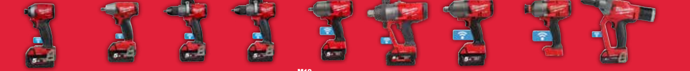
M18 ONEID2-502X 4933464091 | M18 ONEI12-502X F: 4933451374 P: 4933451372 | M18 ONEPD2-502X 4933464527 | M18 ONEDD2-502X 4933464525 | M18 ONEFHIW12-502X F: 4933459727 P: 4933459725 | M18 ONEFHIWF1-802X 4933459733 | M18 ONEFHIWF34-502X 4933459730 | M18 ONEFHIWH716-0X 4933479152 | M18 ONEFPRT-202X 4933478602