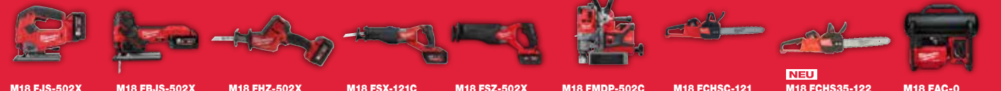
M18 FJS-502X 4933464727 | M18 FBJS-502X 4933464800 | M18 FHZ-502X 4933459885 | M18 FSX-121C 4933464484 | M18 FSZ-502X 4933478291 | M18 FMDP-502C 4933451012 | M18 FCHSC-121 4933471442 | NEU M18 FCHS35-122 4933479679 | M18 FAC-0 4933472166