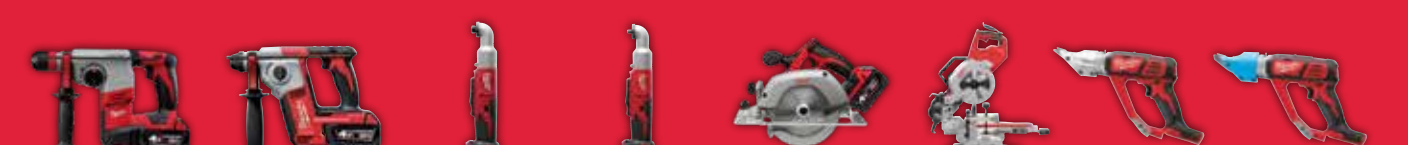
HD18 HX-402C 4933441280 | M18 BH-402C 4933443330 | M18 BRAID-0 4933447891 | M18 BRAIW-0 4933447899 | HD18 CS-402B 4933441400 | M18 SMS216-0 4933471057 | M18 BMS12-0 4933447925 | M18 BMS20-0 4933447935