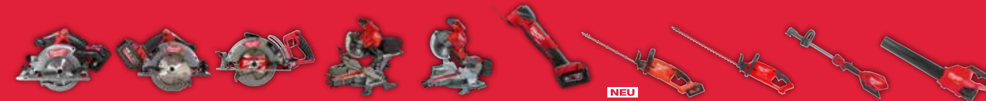
M18 CCS55-502X 4933451376 | M18 FCSG66-121C 4933471195 | M18 FCSRH66-0 4933471444 | M18 FMS190-0 4933459619 | M18 FMS254-0 4933451729 | M18 FMT-502X 4933478492 | M18 FHT45-802 4933480113 | M18 CHT-0 4933459346 | M18 FOPH-0 4933464954 | M18 FBL-0 4933459825