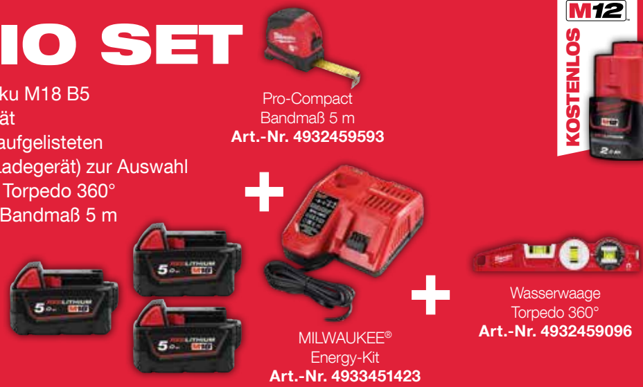
Pro-Compact Bandmaß 5 m Art.-Nr. 4932459593

3 x 18 V/5,0 Ah REDLITHIUM™ Akku M18 B5 inkl. 1 x M12-18FC Schnellladegerät + drei der auf dieser Doppelseite aufgelisteten 18-Volt-Geräte (ohne Akku und Ladegerät) zur Auswahl + 1 x MILWAUKEE® Wasserwaage Torpedo 360° + 1 x MILWAUKEE® Pro-Compact Bandmaß 5 m