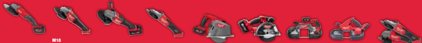
M18 FLAG230XPDB-121C 4933464115 | M18 FHSAG150XPDB-0X 4933471085 | M18 FHSAG150XB-0X 4933471084 | M18 FHSAG125XPDB-552X 4933471080 | M18 FSAGF125XB-0X 4933478436 | M18 FMCS66-121C 4933472111 | M18 FMCS-502X 4933459193 | M18 CBS125-502C 4933448195 | M18 FBS85-202C 4933471497 | DAS GANZE WINKELSCHLEIFER-SORTIMENT FINDEN SIE IN UNSERER PROGRAMMÜBERSICHT.