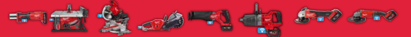
M18 ONEBLHPT-302C 4933478306 | M18 FTS210-121B 4933464225 | M18 FMS305-121 4933471122 | M18 FCOS230-121 4933471697 | M18 ONEFSZ-502X 4933478294 | M18 ONEFHIWF1DS-121C 4933472072 | M18 ONEFSAG125XPDB-502X 4933478435 | M18 ONEFLAG230XPDB-122C 4933478783