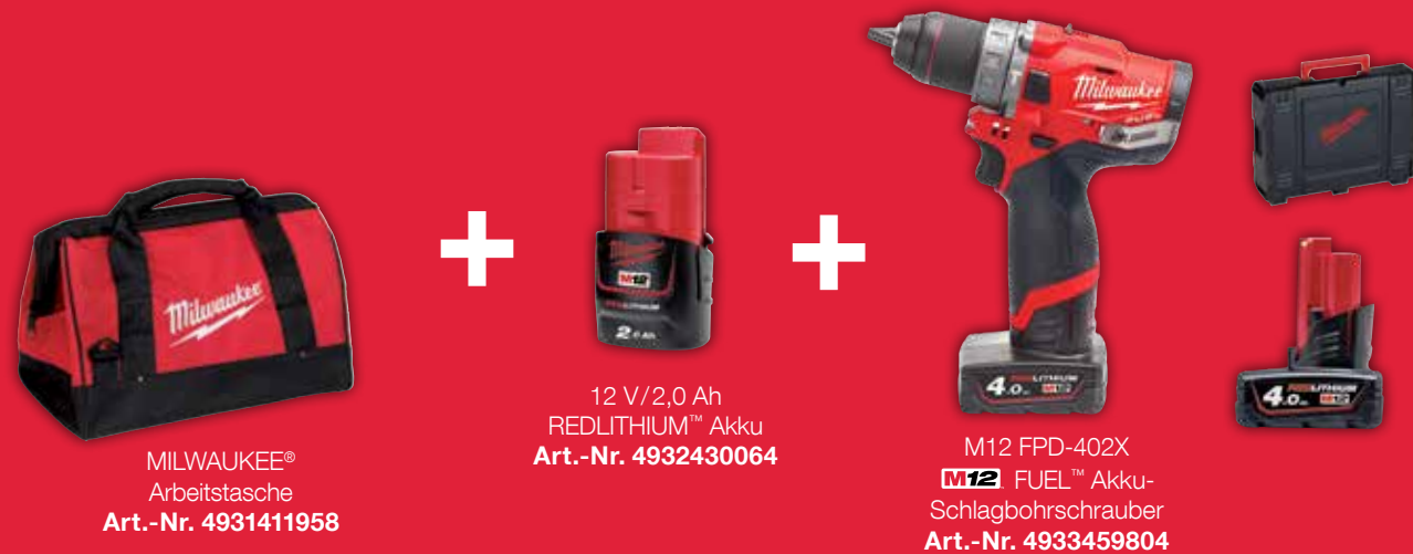
MILWAUKEE® Arbeitstasche Art.-Nr. 4931411958

12 Volt FUEL™ Akku-Schlagbohrschrauber M12 FPD inkl. 2 x 12 V/4,0 Ah REDLITHIUM™ Akku und Ladegerät C12 C in HD Box + 1 x 12 V/2,0 Ah REDLITHIUM™ Akku M12 B2 + zwei der auf dieser Doppelseite aufgelisteten 12-Volt-Geräte (ohne Akku und Ladegerät) zur Auswahl + 1 x MILWAUKEE® Arbeitstasche.