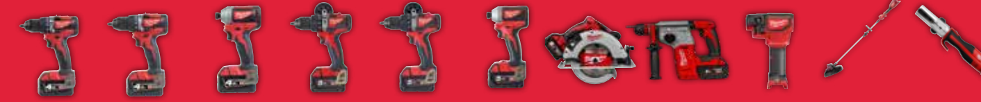
M18 CBLPD-402C 4933464537 | M18 CBLDD-402C 4933464539 | M18 CBLID-402C 4933464534 | M18 BLPD2-502X 4933464517 | M18 BLDD2-502X 4933464515 | M18 BLID2-502X 4933464520 | M18 BLCS66-502X 4933464590 | NEU M18 BLHX-502X 4933478892 | M18 BLTRC-522X 4933471151 | M18 BLLT-0 4933472218 | M18 BLHPTXL-502C 4933479441