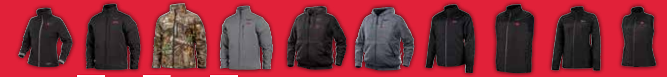
M12 HJ LADIES2-0(M) 4933464840 M12 HJ BL5-0 (L) 4933478969 M12 HJ CAMO6-0 (L) 4933478979 M12 HJ GREY5-0 (L) 4933478974 M12 HH BL3-0 (L) 4933464348 M12 HH GREY3-0 (L) 4933464354 M12 HJP-0 (M) 4933464365 M12 HBWP-0 (M) 4933464371 M12 HJP LADIES-0 (M) 4933464341 M12 HBWP LADIES-0 (M) 4933464804